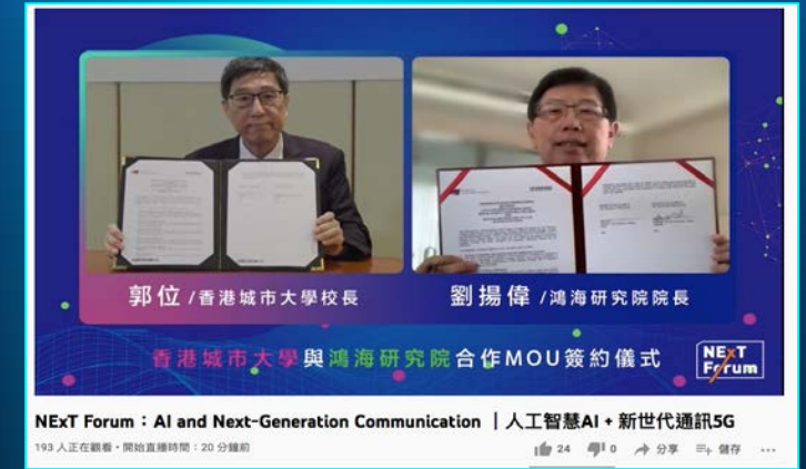
2021/06/06 AI 與新世紀通訊論壇